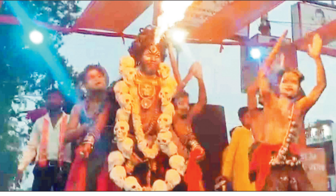
शोभायात्रा में शामिल उड़ीसा का कालाहांडी कटपा।