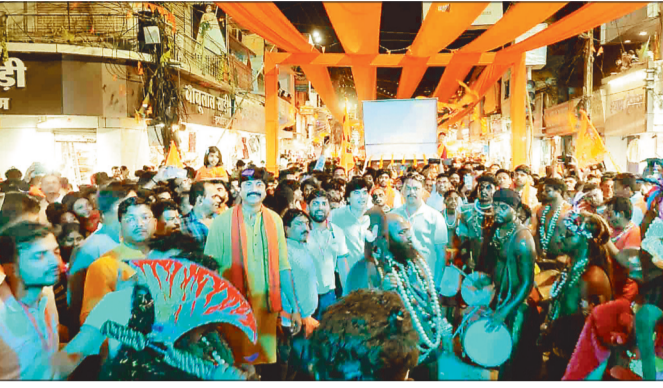
शोभायात्रा में शामिल युवा।